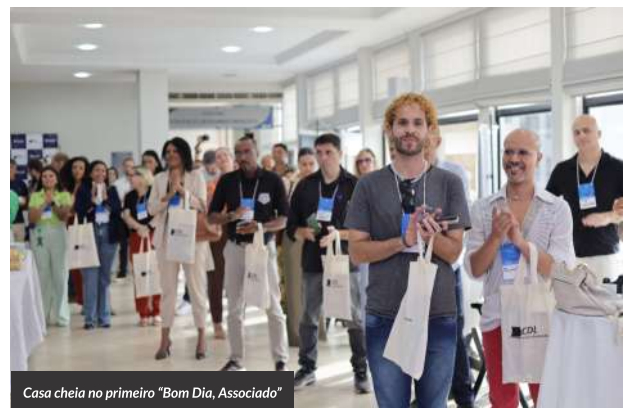
Casa cheia no primeiro “Bom Dia, Associado”